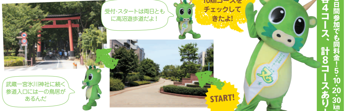
11/25(日)見沼田圃北側コース