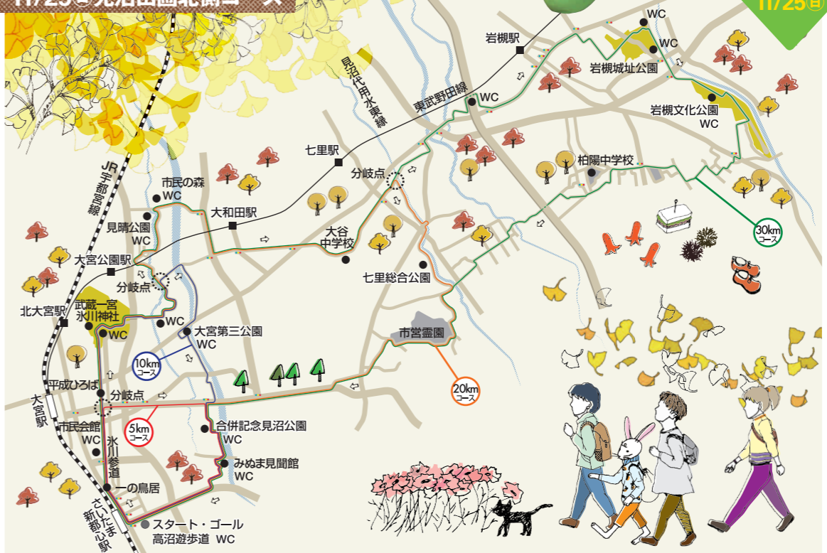
※コースについては変更となる場合があります。あらかじめご了承ください