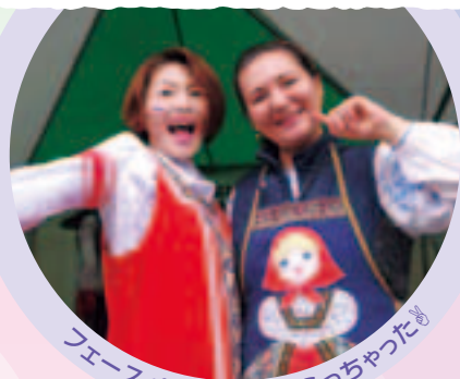
フェースペイントしてもらっちゃったよ

ふれあい コーナーでは、特に フェースペイントや ピニャータ、民族衣装 などが、子供たちに 大人気でした。