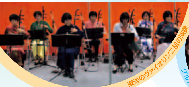
東洋のヴァイオリン二胡の演奏