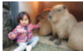
▲カビバラちゃんと「ハイ、チーズ!!」

A:国籍や見た目、言葉に関係なく誰とも仲良くなれる人。また、国際社会でも生きていけるように自分の意見をしっかりとと言える人、そして日本人とペルー人であることに誇りを持って生きてほしいです。