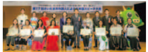
▲昨年度の集合写真