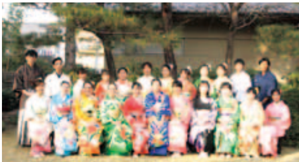
▲昨年度の集合写真

さいたま市の外国人の方を対象に着物着付け体験会を行います。着付けの他、茶道や風呂敷包み、着物で初詣を体験できます。