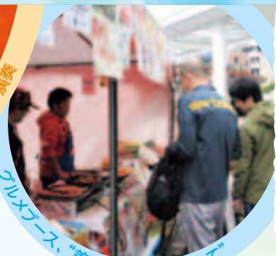
グルメブース、「美味しさ半端ないって」