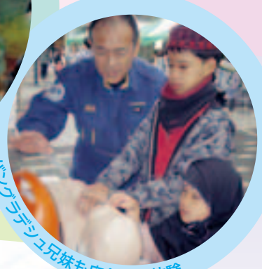
バンドラデジユ兄妹も応急手当体験