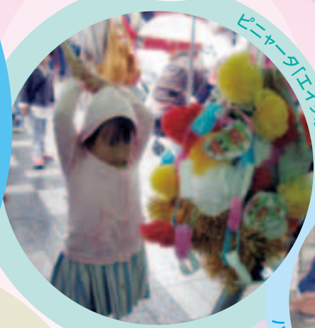
ピニャータエイツ!