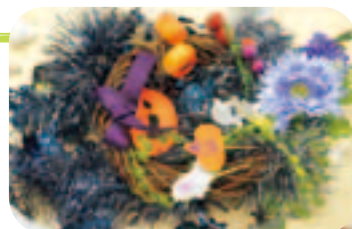
ハロウィンの飾り カワイイ♡