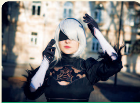
▲コスプレ決まっていますね。

く、想像と違っていたので少し残念です。もっといろいろお話を、友達になりたいと思っていますが、特に男子は積極的に話しかけてくれる人が少なくちょっとさみしいです。