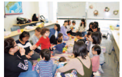
昨年3月に行われた交流会の様子

ボランティアの仕事は、交流会の企画、準備、当日のセッティング、小さいお子さんの遊び相手等々、平日午前中に行っています。子育て真っ最中のママから大ベテランのママまで、スタッフ会議も女子会の雰囲気でも盛り上がりがあります。