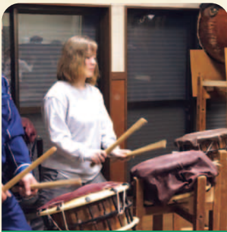
▲力強い太鼓、カッコいい!!

アニメやネットの情報でよく知っていたつもりですが、実際日本に来てみると皆さん、はにかみ屋で照れ屋な人が多