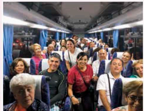
2019トルカ市からの方々と共に(中央左、白ウェア) ▲