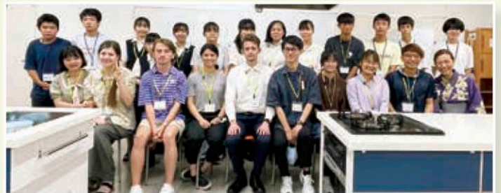
講師・参加者全員で一枚▲