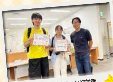
ホストファミリーと初対面

参加したホストファミリーと留学生の両者とも、楽しく有意義な1日を過ごすことができました。