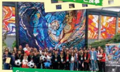
Cosmovital Jardín Botánico（コスモビトラル植物園）で交流を深めました