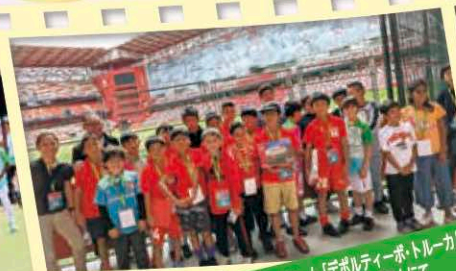
トルーカのプロサッカーチーム「デポルティーボ・トルーカ」の本拠地ネメシオ・ディアススタジアムにて