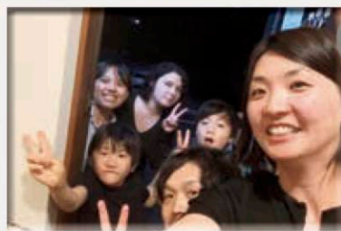
すっかり打解けて、あつという間の体験でした。(左後方、2名の留学生)