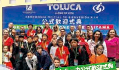
トルーカ公式歓迎式典