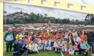
トルーカの人達と