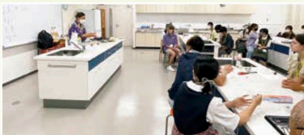
▲講師の説明を熱心に聞く参加者