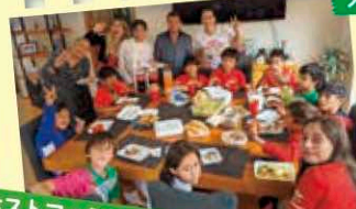
ホストファミリーと食事