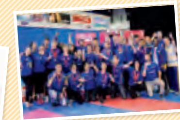
△全英大学選手権にて優勝