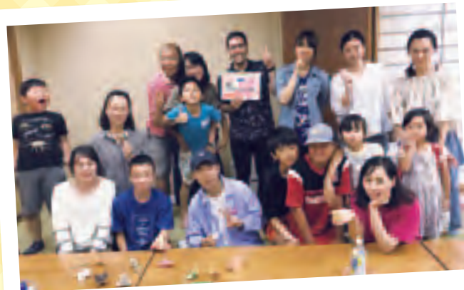
△3世帯合同で交流を楽しみました 本当の兄弟ができたみたいで、子供たちも大喜びです