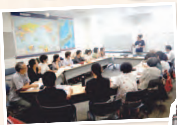
△ジャコモ先生の授業風景