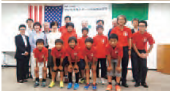
△壮行会での集合写真(上)少年野球団(下)少年サッカー団