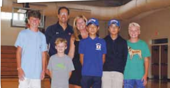
ホストファミリーとご対面