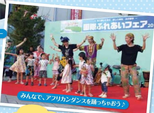
みんなで、アフリカンダンスを踊っちゃおう♪