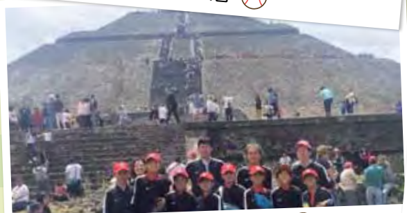
テオティワカン前で