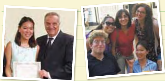
△イタリアオペラマスタークラス修了証 △仲間との記念写真

現地で、文化に触れながらイタリア語を習得することで、歌詞の意味を深く捉え、自分なりの音楽の表現を学ぶことは、とても意味があることだと思います。新しい環境に一步を踏み出すのは、とても勇気がいることです。ただ、自分の目標に、ひたすらまっすぐ自分を信じて進めば、きっと道は開けます。