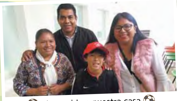
Bienvenido a nuestra casa