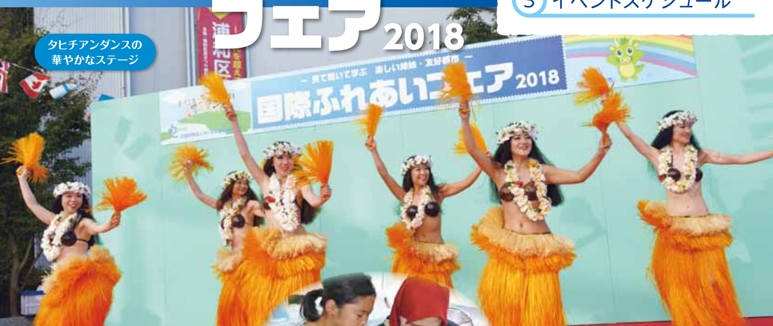
タヒチアンダンスの 華やかなステージ

10月7日(日)、秋には珍しい真夏日の中、浦和駅東口駅前市民広場にて、「国際ふれあいフェア2018」が開催されました。