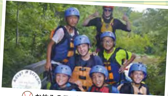
お休みの日はみんなで川下りへ

さいたま市の姉妹友好都市である、メキシコ・トルーカ市へはサッカーの、アメリカ・リッチモンド市へは野球のスポーツ少年団が派遣されました。選手たちは、ホームステイをしながら、現地の大会に参加する等、国際交流を楽しみました。