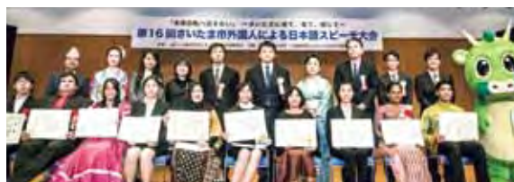
△第16回全体記念写真

さいたま市在住、在勤、在学の外国人が、日常の中で感じたことや考えたことを日本語でスピーチします。皆さま是非、会場へお越しください!