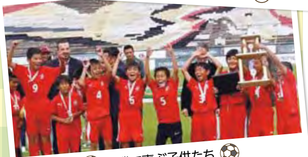
優勝で喜ぶ子供たち