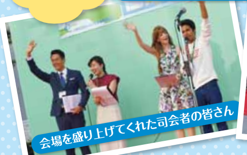
会場を盛り上げてくれた司会者の皆さん