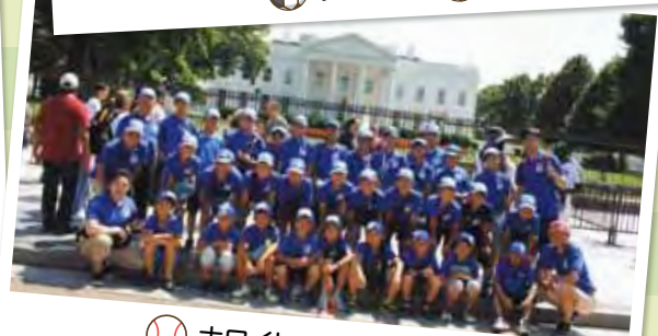
ホワイトハウス前で