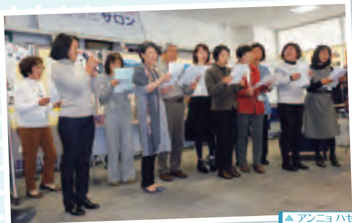
▲ アンニョ ハセヨ〜!