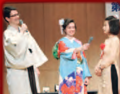
流暢な日本語でインタビュー