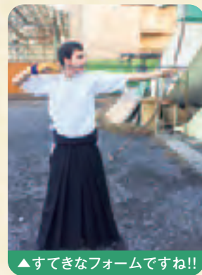
▲すてきなフォームですね!!