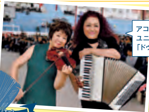
アコとヴァイオリンの ユニット 「ドウ・マルシェ」