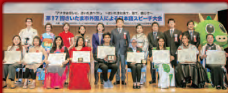
華やかな民族衣装で記念撮影