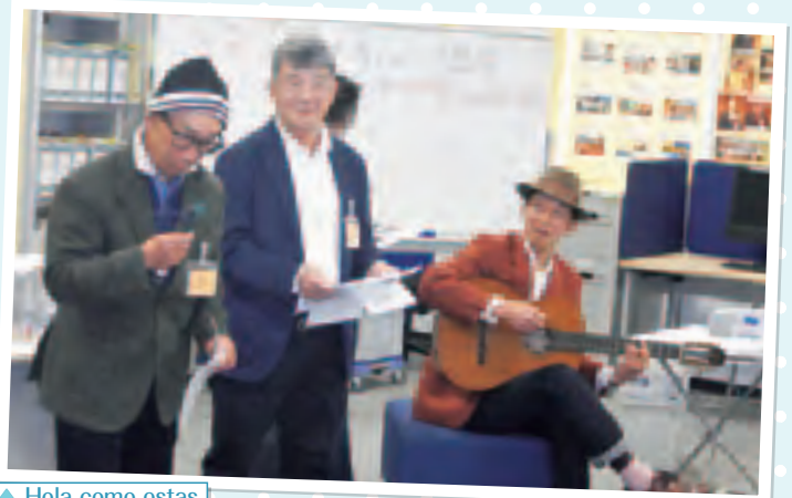
▲ Hola como estas