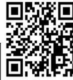
iOS版 (App Store)