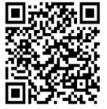
Android版 (Google Play)