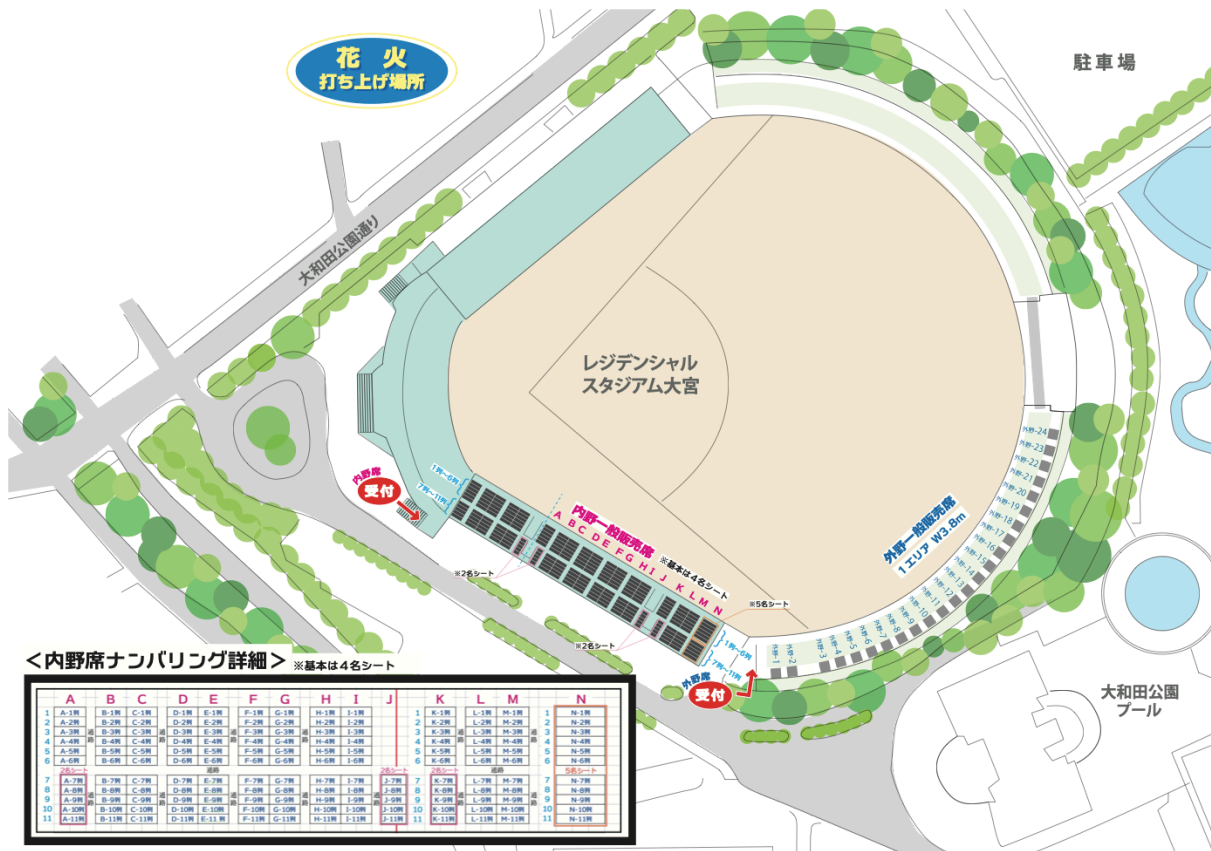
<内野席ナンバリング詳細> ※基本は4名シート